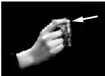
矢印の部分に指をかけ、ゆっくりとめくるようにはがします