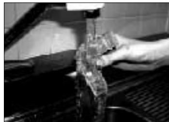
粘着力が弱くなったら、水で洗うかぬれた布で拭き、乾かしてからご使用下さい(水洗いの時中性洗剤を使うとより効果的です)。