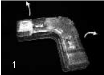
1 両サイドのレバーを起こします