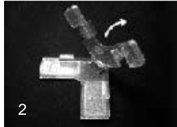
2 本体上部を止まるまで(90度) 隠す